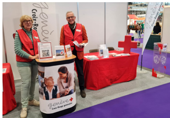
Les Automnales à Palexpo (Bébé, junior et nous)