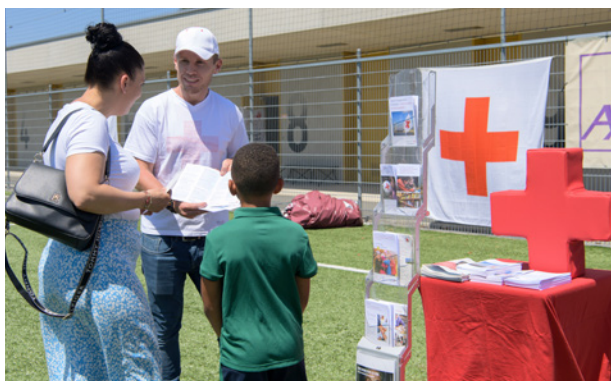
Stade en famille à Vernier