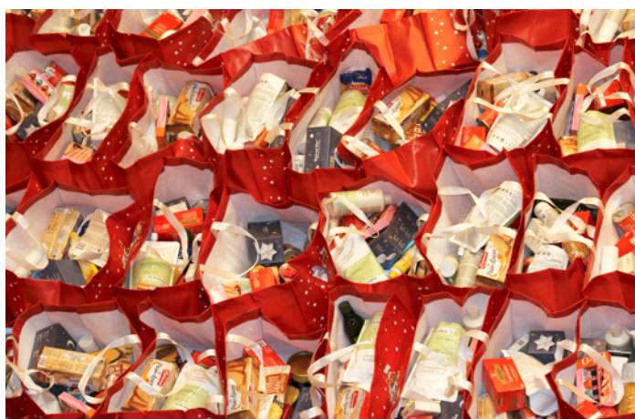
Des Paniers de Noël attendent d'être remis à des familles, des couples, ou des personnes vulnérables.

« Le sourire des gens et le bonheur des enfants quand ils reçoivent leur cadeau démontrent bien l'importance de cette action ! »