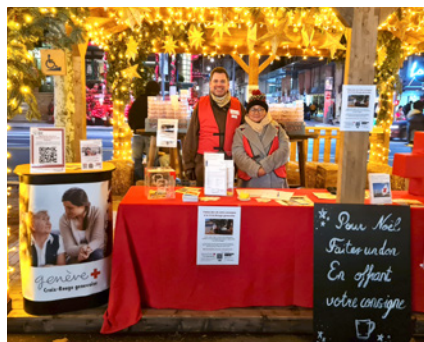
Marché de Noël au quai