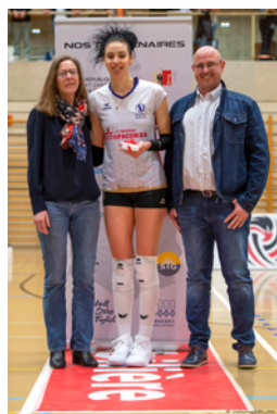
Match - Genève Volley