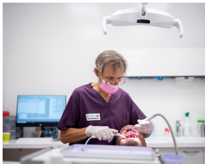
Un bénéficiaire se fait soigner une carie à prix modique, grâce à la Permanence de soins dentaires.

« Mon compagnon peut maintenant chercher du travail sans se soucier de l'aspect de sa bouche. Il avait honte et n'osait pas se présenter aux entretiens. Grâce à son traitement, il peut s'y rendre avec plus de confiance en lui. »