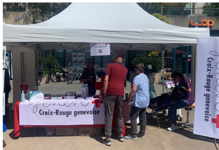
Stand de sensibilisation à l'hygiène bucco-dentaire de la Permanence de soins dentaires, à l'occasion de la « Journée de prévention-santé publique », à Plan-les-Ouates, mai 2023.

Ouverte depuis novembre 2020, la Permanence de soins dentaires est destinée aux personnes majeures, établies à Genève depuis au moins deux ans, non éligibles à des prestations sociales, qui travaillent, mais n'ont malgré tout pas les moyens de financer leurs frais dentaires (les travailleuses et travailleurs pauvres). La pénurie d'hygiénistes dentaires en Suisse, ainsi que les disponibilités restreintes des dentistes bénévoles, a provoqué une baisse de l'activité par rapport à l'année