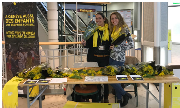
Stand de vente de mimosas par deux bénévoles, pour offrir des loisirs aux enfants et adolescent-e-s défavorisés.

La Croix-Rouge genevoise organise des activités ponctuelles plusieurs fois par an. Entièrement assurées par des bénévoles, ces activités apportent une aide concrète aux personnes en difficulté à Genève.